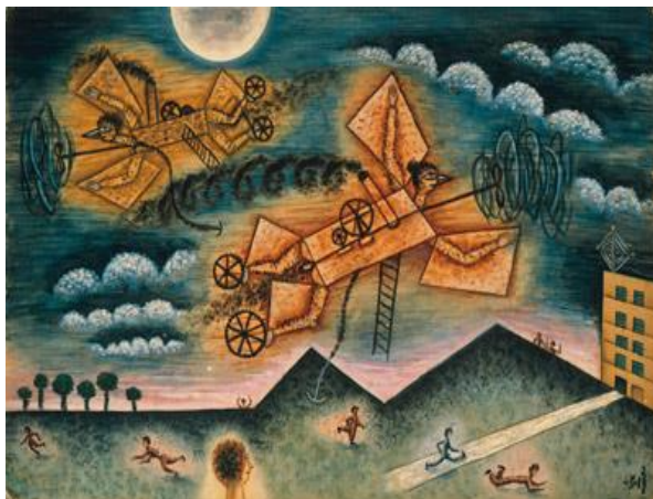
FIG. 2 - Xul Solar. Mestizos de avión y gente . 1936. Aquarela sobre papel, 32 x 46 cm.

FONTE - MUSEO DEL ARTE LATINOAMERICANO; PINACOTECA DO ESTADO DE SÃO PAULO, 2005, p. 122. Catálogo de exposição.