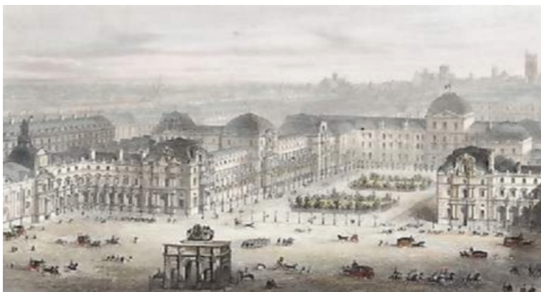
Imagem 2 – “O Carrousel de Haussmann”