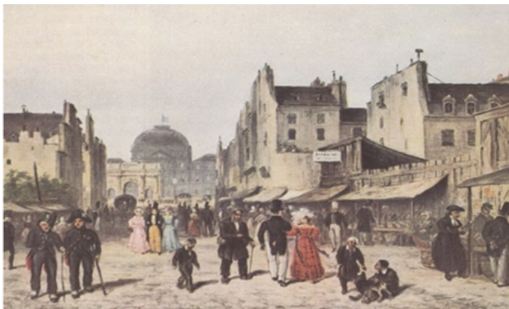
Imagem 1 – “O Carrousel em 1848. Ao fundo, o Arco do Triunfo e o Palácio das Tulherias”