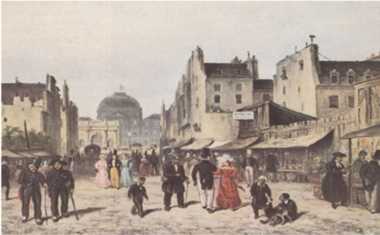
Imagem 1 – “O Carrousel em 1848. Ao fundo, o Arco do Triunfo e o Palácio das Tulherias”