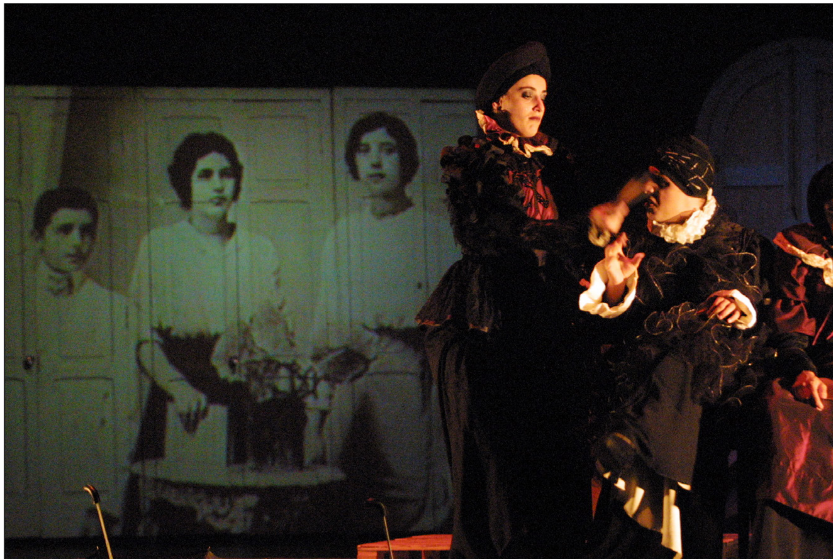
A CASA DE BERNARDA ALBA (Oficina Multimédia)