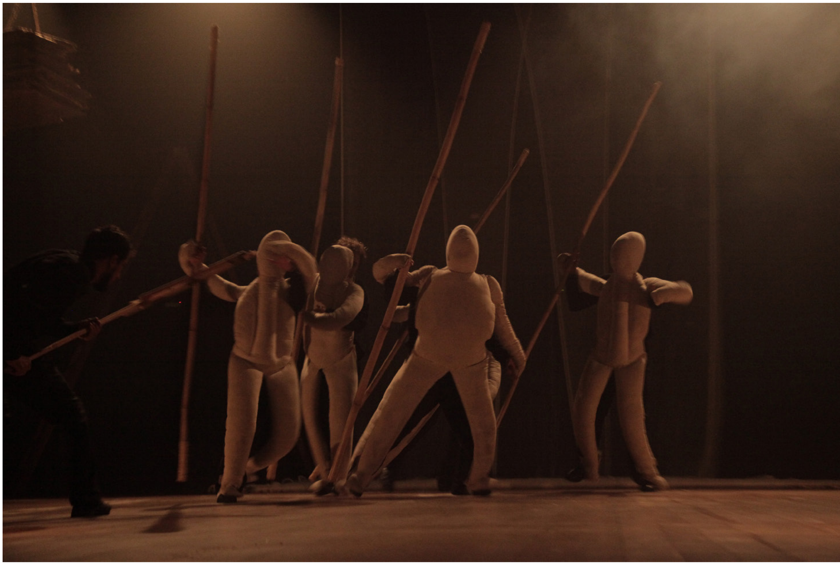
GRUPO OFICCINA MULTIMÉDIA. 40 anos. Em Tese , Belo Horizonte, V. 24, N. 3, P. 312-339, SET-DEZ. 2018.