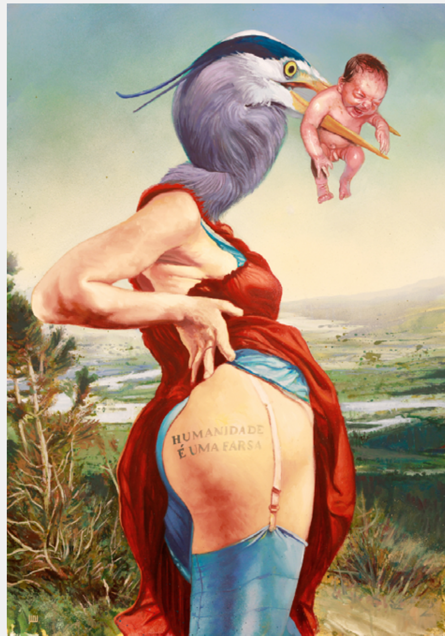
Idem, 2012 Acrílica, spray e óleo sobre tela 100 x 70 cm