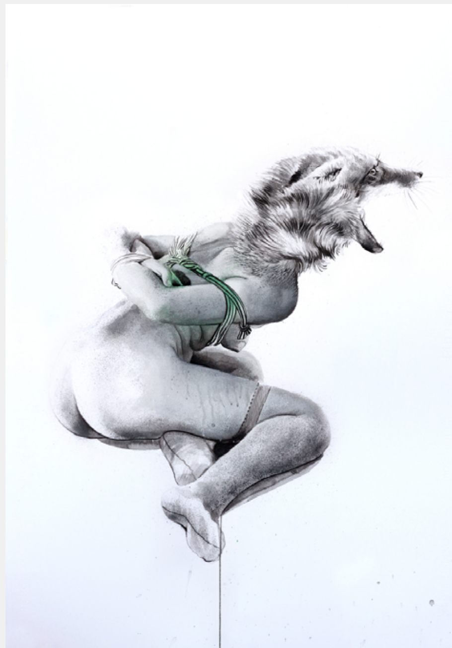
Dominação, 2012 Nanquim, spray e acrílica sobre papel 100 x 70 cm