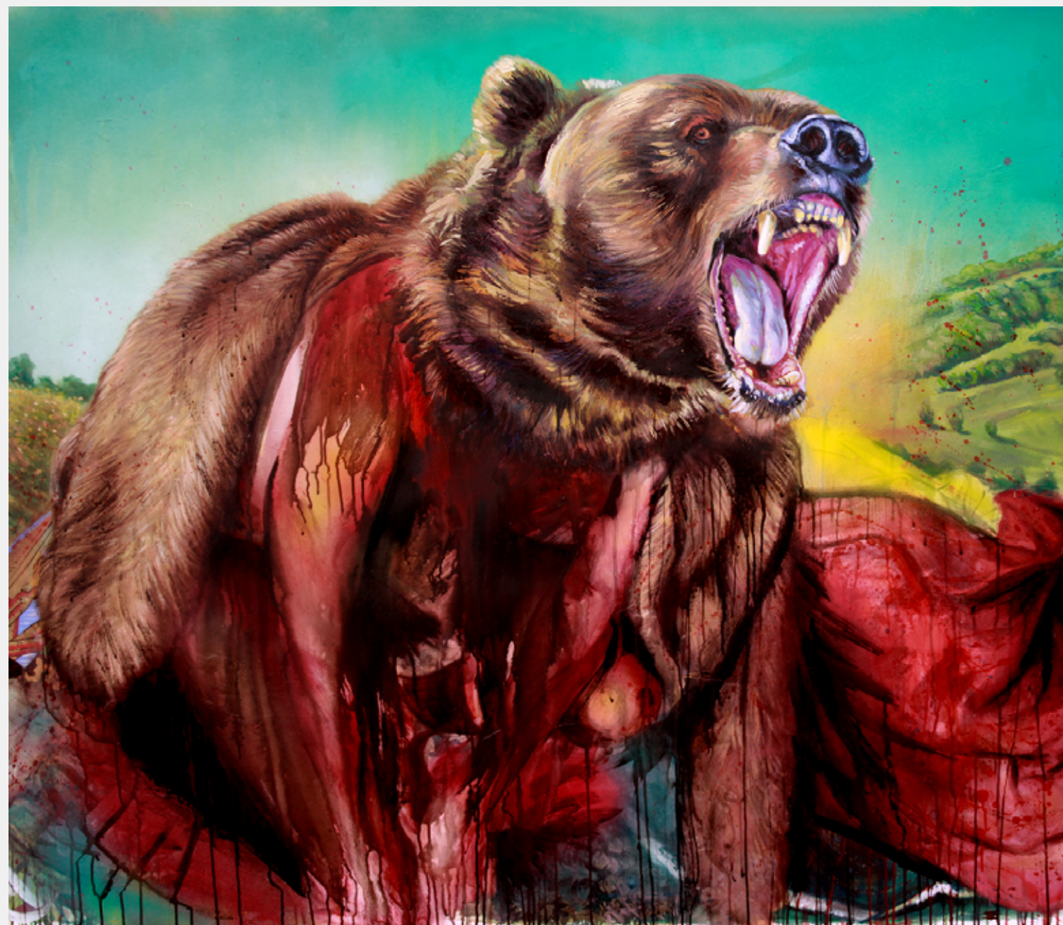
Fúria ornamental ou quando resolvi beber e foder em seguida, 2012 Mista sobre tela 150 x 130 cm