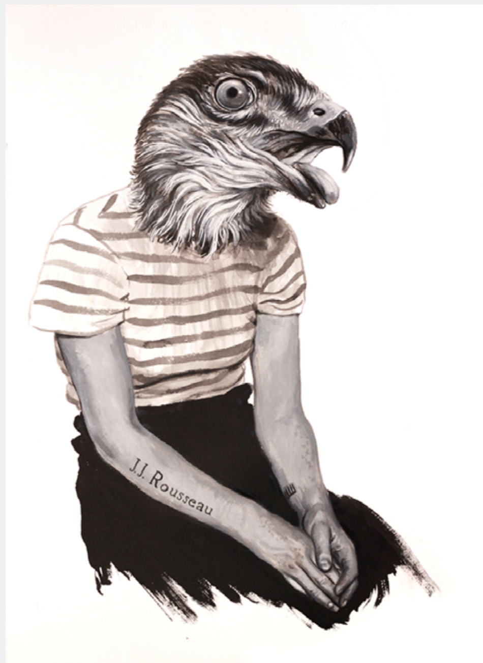
Rousseau, 2012 Extrato de noqueira e acrílica sobre papel 70 x 70 cm