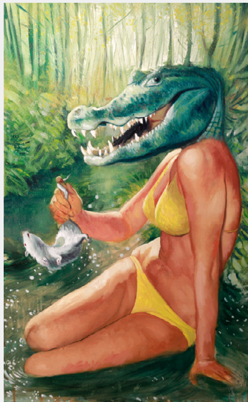
Sorriso da animosidade, 2012 Óleo sobre tela 50 x 80 cm