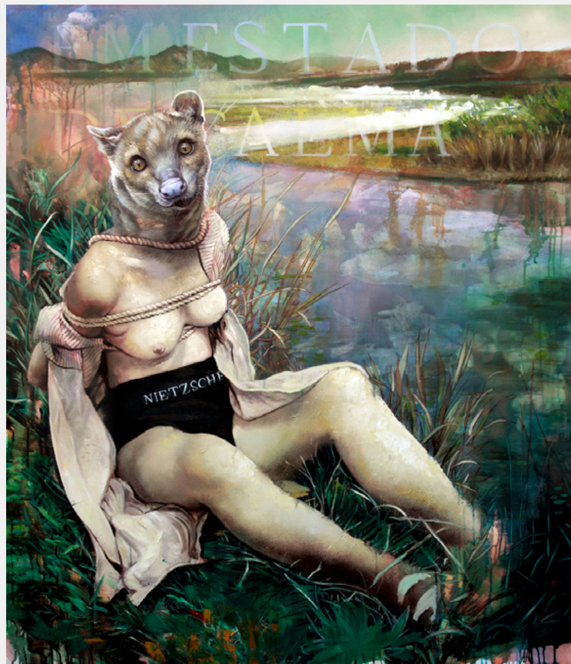
Superfície Em Estado de Calma, 2012 Mista sobre tela 150 x 130 cm