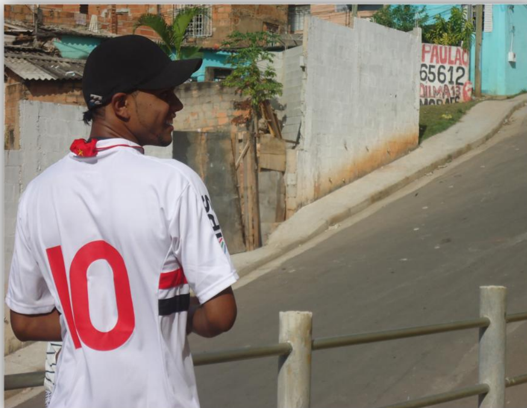
Capa da revista FuLiA / UFMG , v. 2, n. 3, 2017.