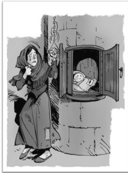
Figura 2: O ato velado da entrega na “roleta”

A humanização, revestida pela caridade como forma de solidariedade aos menos assistidos, começou a tomar força no âmbito da igreja católica, através das denominadas ‘Casas de Misericórdia’, que recebiam apoio econômico da esfera pública, bem como privada. Parece que, com a chegada da idade da razão (7 anos), as crianças eram transferidas para internatos, tanto de meninas quanto de meninos, sob a direção de freiras e de padres respectivamente. Não obstante, como já discutido por SILVA,