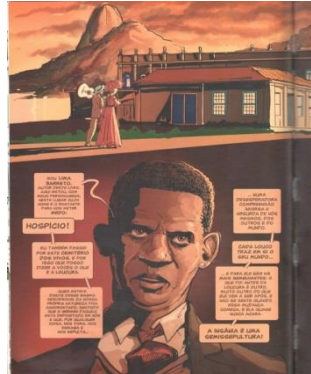
Figura 1 - Desabafo de Lima Barreto sobre a loucura